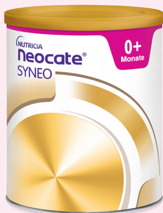
Neocate® SYNEO mit Prä- und Probiotika, bei allen Symptomen der Kuhmilcheiweißallergie