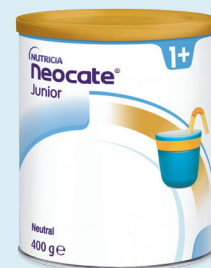
Neocate® Junior Optimal an die Bedürfnisse älterer Kinder angepasst