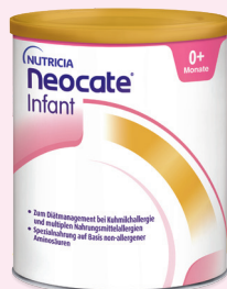
Neocate® Infant Die „pure“ Formula, wenn der Einsatz von Prä- und Probiotika nicht indiziert ist